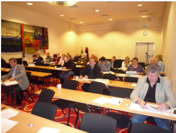
Regiontinget i møte 2. desember 2010

Ordinært regionting ble avholdt 2. desember 2010 i Alta. Dette var det 4. ordinære regionting.