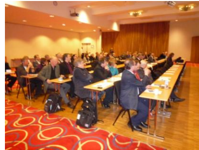
Regionrådene i Nord-Troms og Finnmark

Andre dag drøftet man veien videre gjennom følgende innledninger: