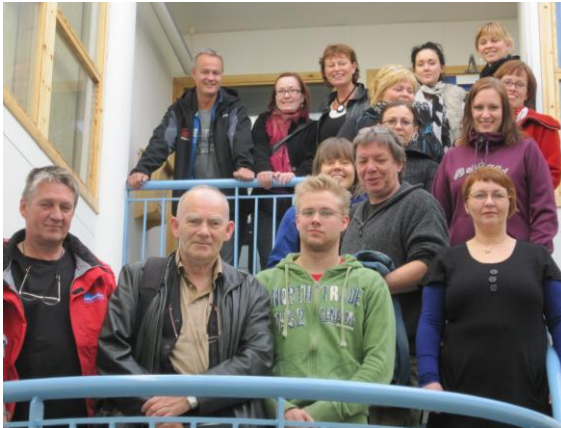
Deltakere i Kunnskapsfangst i Europa

program samt en liten egenandel. Apriori Utvikling AS har ansvaret for gjennomføring av prosjektet.