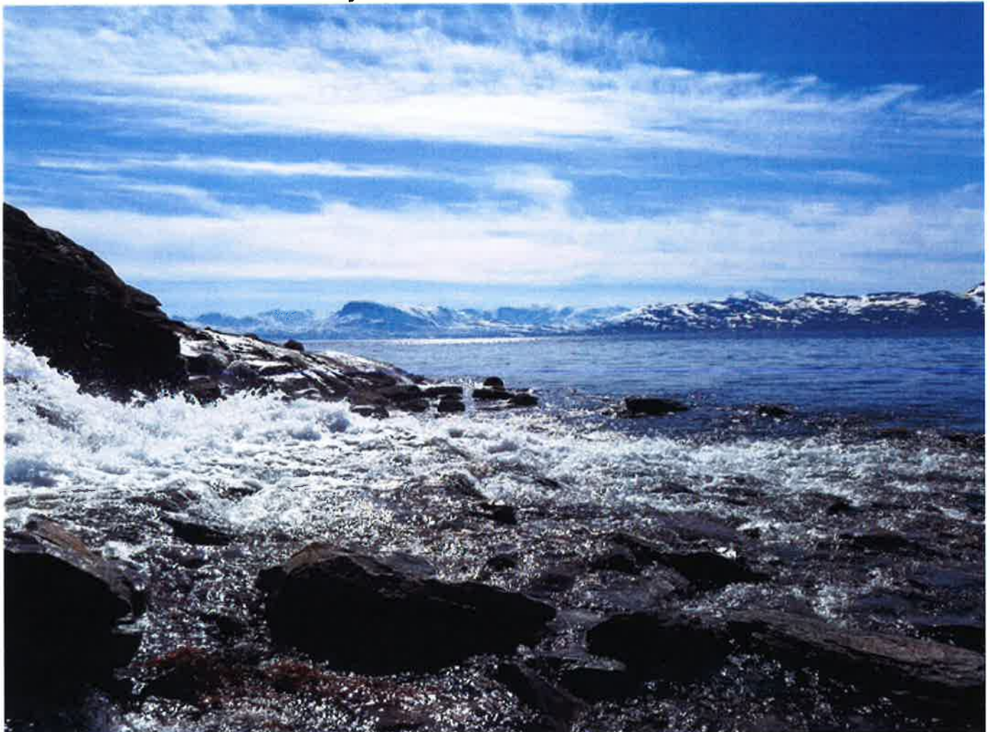
Bekk med utløp til sjø.

Porsanger og Vadsø kommuner får til sammen tre millioner kroner til opprettelse av prosjektlederstillinger i Finnmark vannregion. Målet er å beskytte og forbedre vannmiljøet.